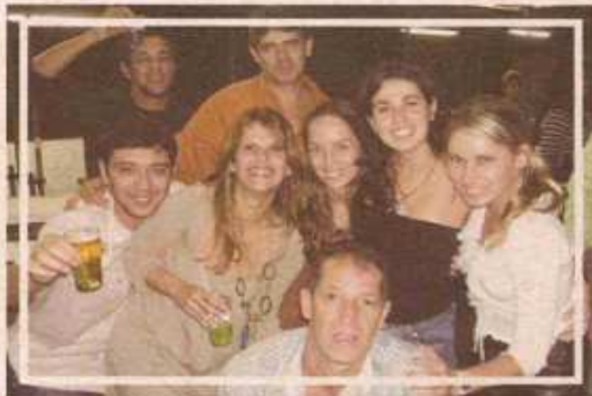
Na festa da enfermagem, alegria geral

Em comemoração ao dia da Enfermagem, a Fundação Eletronuclear de Assistência Médica realizou no Quioscão, em Praia Brava, uma festa para reunir a categoria e celebrar a data. Participaram do evento enfermeiros, técnicos, seus familiares e funcionários de outros setores da FEAM. Foi servido um delicioso bufê e todos puderam dançar à vontade ao som da banda Tempestad. O grupo, formado por jovens músicos do Perequê, lembrou sucessos de bandas consagradas como Legião Urbana e Paralamas do Sucesso e também tocou canções próprias, que caíram no gosto do público. Quem foi, dançou e se divertiu pra valer. No ano que vem tem mais.