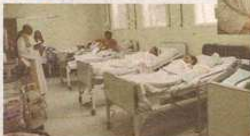
O bispo na enfermaria obstétrica...