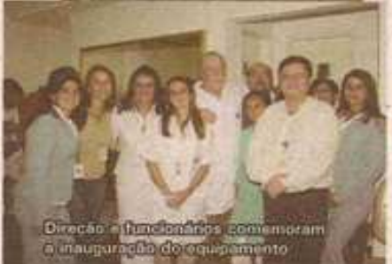
Direção e funcionários comemoram a inauguração do equipamento