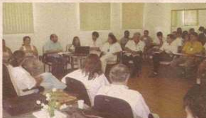
Cursos de capacitação acontecem com frequência na FEAM