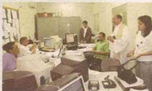
... e no setor de faturamento